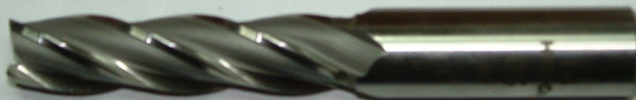
20-as hengeres szárú HSS maró 4-élű Kód:05