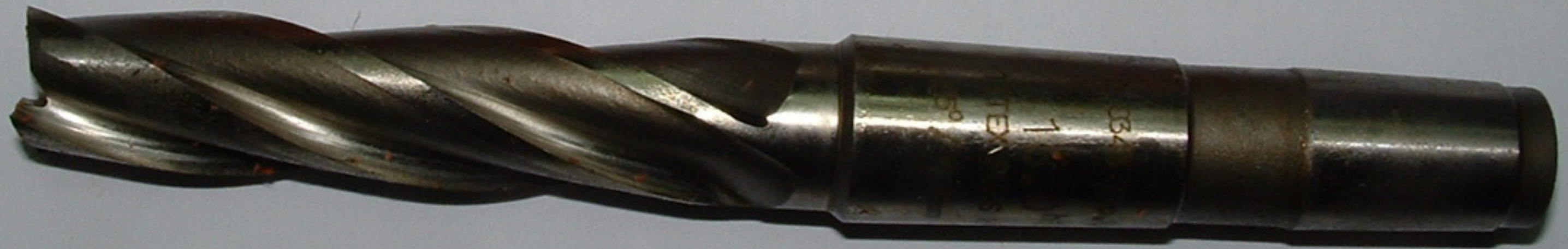
20-as TITEX PLUS HHS-E 4-élű maró Kód: 03