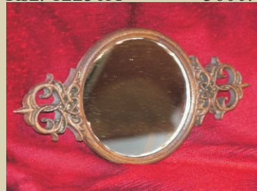
Befoglaló méretei: ~21x12cm