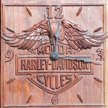
Rsz: 11206A 7200.-