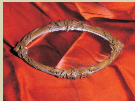
Rsz: 12227A 4800.- befoglaló méret: ~36x22cm