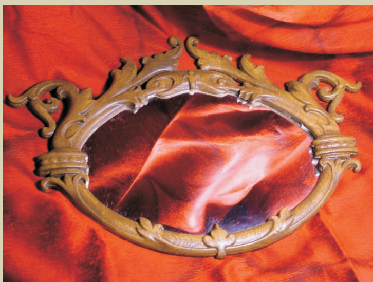
Rsz: 12226A Befoglaló méretei: ~52x36cm 12600.-